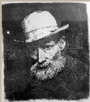
Presunto autoritratto di Salomon André Biosecq