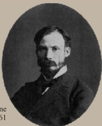
Renoir giovane nel 1861